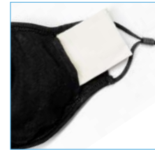
insertion possibility for a filter / cloth

Manufacturer / supplier: FARE – Guenther Fassbender GmbH Stursberg II 12 D-42899 Remscheid info@fare.de www.fare.de