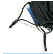
adjustable elastic bands